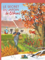
le jardin et les saisons