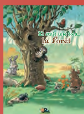
La forêt et les contes