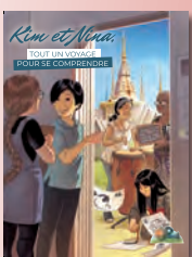
La diversité des langues

Pour visionner la bande-annonce, pour écouter des extraits de chansons ou pour davantage d'informations, visitez notre site internet : www.planetemomes.fr