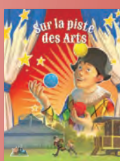
Les arts et les couleurs